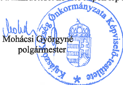
Mohácsi Györgyné polgármester

14. § Ez a rendelet a kihirdetését követő napon lép hatályba és az azt követő napon hatályát veszti.